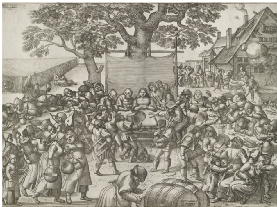
Boerenbruiloft – Pieter van der Borcht

Geheel in de geest van de Rederijkers volgt het slotwoord waarin betoogt wordt dat alle kolder eigenlijk wel serieus bedoeld is. Het belangrijkste was dat er een kunstwerkje werd voorgedragen.